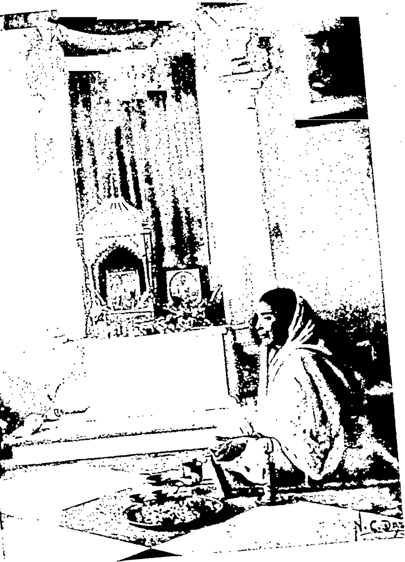
'उद्दोषन' में पूजा-निरत माँ